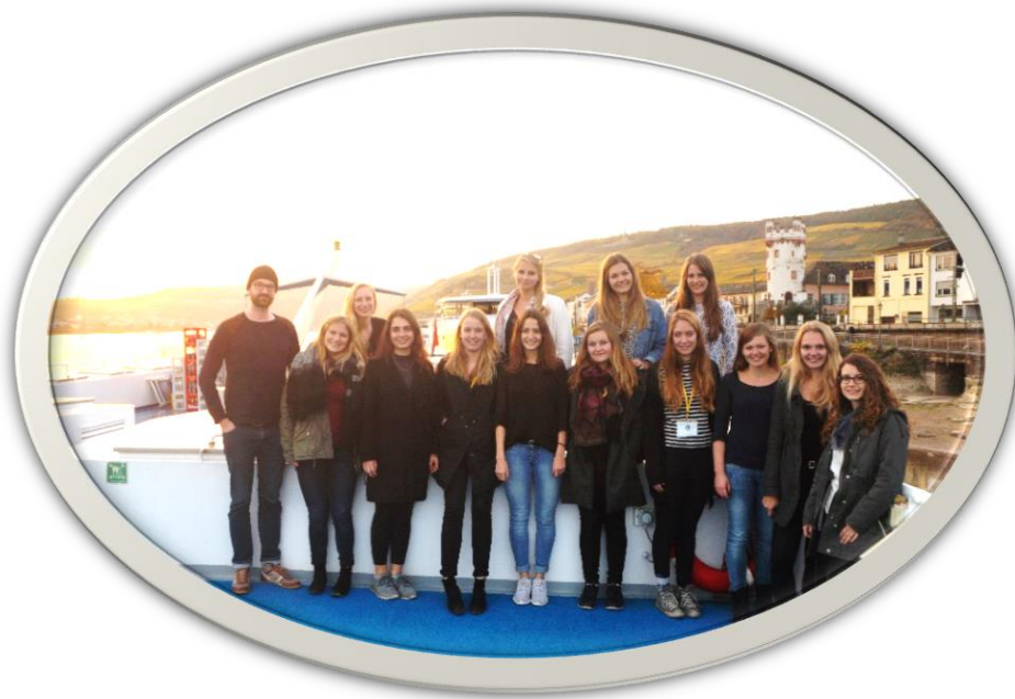
Das Orga-Team der TourKon 2016

Unser größtes Projekt stellt jedoch die jährliche Planung der TourKon dar.